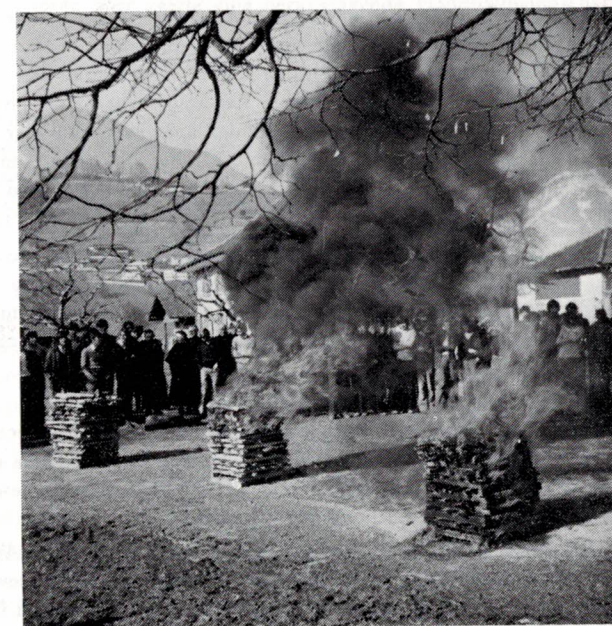
Feuerlösch-Demonstration. Wo sind die Feuerlöscher?